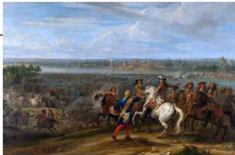
Lodewijk xiv trekt bij Lobith Nederland binnen 1672, Adam Frans van der Meulen

In juni en augustus 1672 braken er in Holland tot twee keer toe ongeregelheden uit die het werk waren van ontevreden burgers en gericht tegen de zittende regenten. De eerste keer was eind juni 1672, toen de doorbraak van het Franse leger en de verovering van 50 steden paniek in het land veroorzaakte, waarbij de burgerij de zittende regenten van verraad beschuldigde. De aanslag op Johan de Witt van 21 juni was aanleiding voor de burgerij om de benoeming van Willem III tot stadhouder van Holland en Zeeland te eisen. De tweede keer was na de moord op de gebroeders de Witt op 20 augustus toen de burgerij het ontslag eiste van incapabele, onbekwame, regenten. Die ongeregelheden zetten zich door na de resolutie van de Staten van Holland van 27 augustus waarin zij de relmakers tegemoetkwamen door de prins toestemming te geven verdachte regenten te ontslaan en te vervangen door anderen. Die resolutie was het sein om de acties tegen ‘verkeerde’ regenten te intensiveren en hervormingen te eisen.