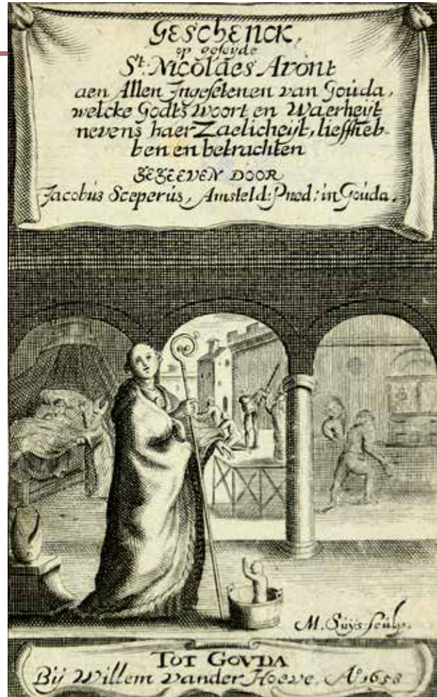
Het titelblad van Geschenck op gesejde St. Nicolaes Avont , SAMH (foto Nico J. Boerboom)

Van dit boekje zijn maar weinig exemplaren overgeleverd. Tegenwoordig kan iedere belangstellende het via het internet op het scherm van de computer laten ver-