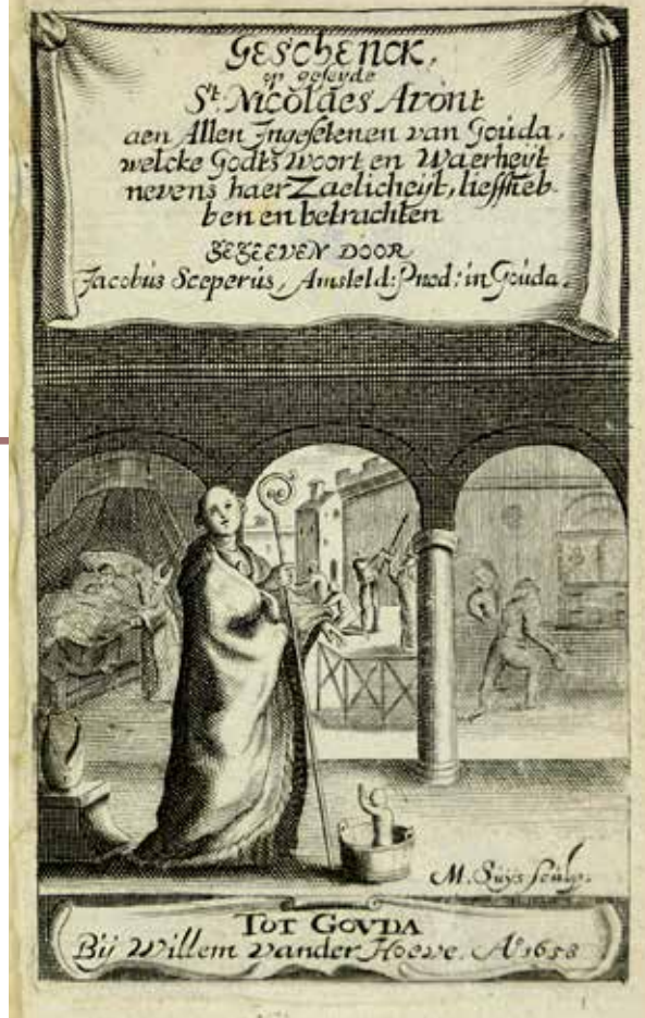
Het titelblad van Geschenck op gesejde St. Nicolaes Avont , SAMH

Voor koning-stadhouder Willem III stond eind 19e eeuw nergens in Nederland een standbeeld. Daarin moest nodig verandering komen, oordeelde men aan het begin van de vorige eeuw. Provincies en steden waaronder Gouda moesten daaraan bijdragen. Ook in onze stad