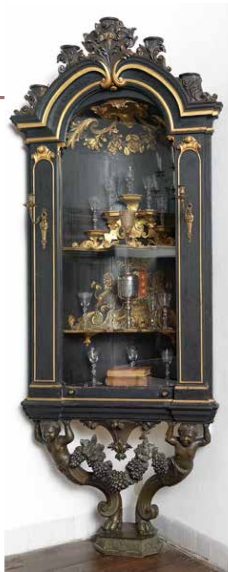
Glazen kast afkomstig van de Goudse schutterij in Museum Gouda