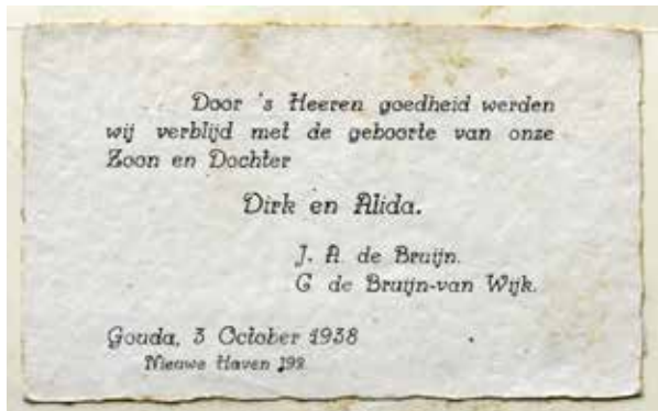
Geboortekaartje 1938 (collectie Vergeer-de Bruijn)

‘Weet je dat ik twijfel had of ik wel mee moest doen met zo’n Gouwe Verhaal? Ik wil mezelf niet in de schijnwerper zetten. Niet uit bescheidenheid, maar omdat ik me afvraag of ik nou zo interessant ben. En als jij zegt dat het leven van elke Gouwenaar interessant is, dan denk ik, waarom zou ik dat openbaar maken? Toch ben ik eroverheen gestapt, omdat ik graag vertel over het Gouda van mijn jeugd. Tot 1952 óf 1953 woonden we op de Nieuwehaven. Je hoeft maar een naam te noemen of een foto te laten zien en de verhalen komen boven. Ik heb een onbezorgde jeugd gehad met Gouda als veilig decor. Als jij denkt dat de lezers van Tidinge dat interessant vinden, prima. Maar hou er rekening mee dat ik veel minder ga vertellen over de periodes daarna.’