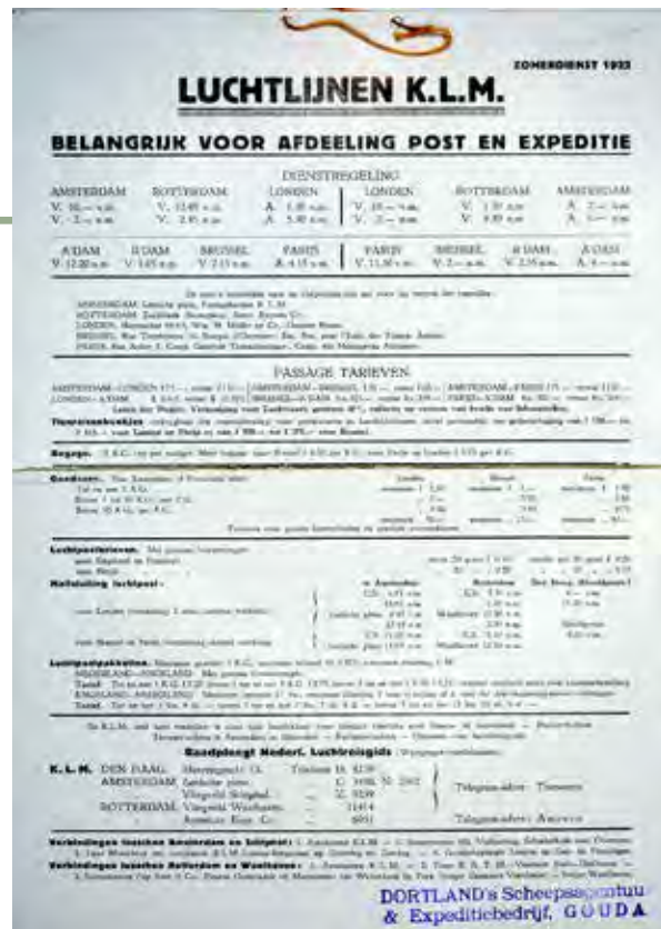
De mogelijkheden van de KLM om luchtpost te vervoeren in 1922