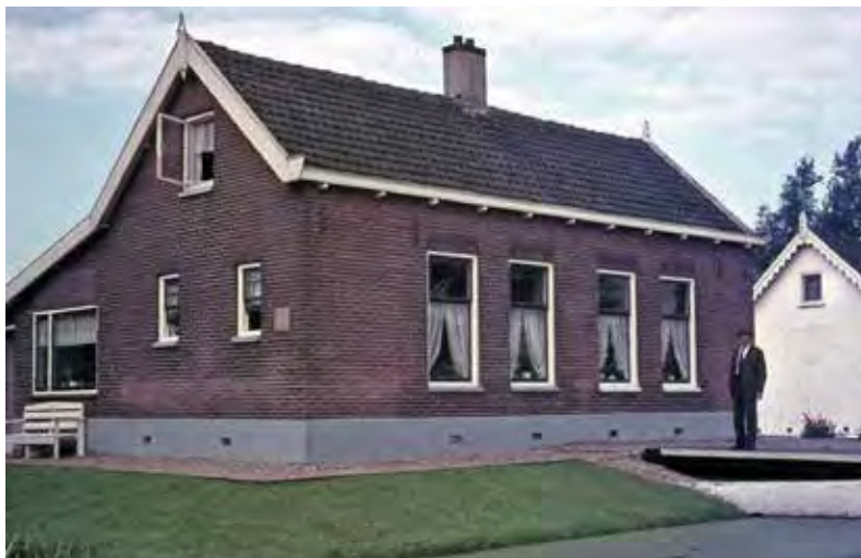
Huis Bloemendaalseweg 59, rechts vader

zijn gezin ook. De bouwtekening ligt in het streekarchief, maar het pand is alweer afgebroken. Daar is nu een groenstrook voorlangs de Azaleasingel.’