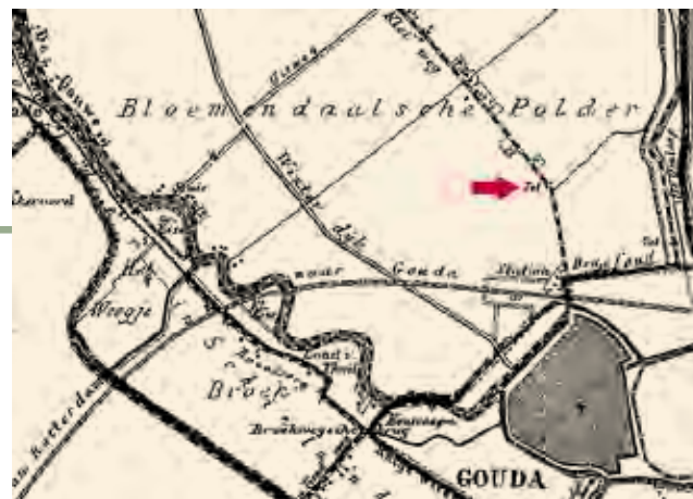
Kaart van J. Kuyper uit 1867 (Hugo Suringar, Leeuwarden)

De kosten van zowel het onderhoud als de investeringen aan dijken en wegen in de polder moesten door de eigenaren van het land, zogeheten ingelanden ( gelant is in het middeleeuws ‘eigenaar van het land’) worden opgebracht. Deels woonden die eigenaren zelf buiten de polder en hadden zij de grond verpacht. De ingelanden van de polder Bloemendaal draaiden dus op voor de kosten van het onderhoud van zowel de dijk langs de Gouwe van de polder Bloemendaal als van het pad op de Winterdijk. Het steeds intensievere gebruik van de Bloemendaalsche Rijweg door met name rijtuigen bracht extra kosten voor onderhoud met zich mee en dwong het polderbestuur uiteindelijk zelfs tot grote investeringen voor verbeteringen aan de weg.