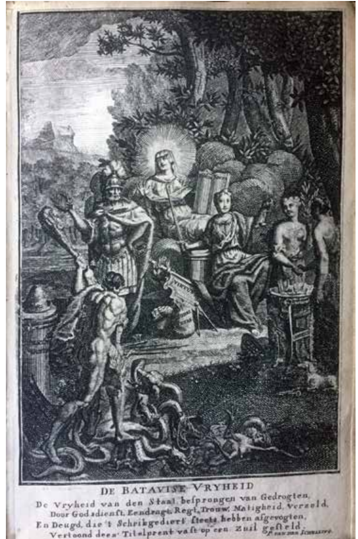
Titelprent van De Lange's Korte verhandeling uit 1730, voorstellende 'De Batavise vryheid'. Met gedicht van muntenkenner Paulus van Schelling

advocaat en regent van de goede, 18e-eeuwse, stem- pel. Zijn bezigheden op het vlak van de muntenkunde en de geschiedschrijving moeten worden beschouwd als verdienstelijke uitingen van een grote liefhebberij. Zijn enige pennenvrucht zal ook geen grote oplage gekend hebben, want het boekje duikt zelden op bij boeken- veilingen. Waarschijnlijk heeft hij het vooral geschreven voor zijn familie en vrienden. Door de zeldzaamheid ligt de waarde tegenwoordig op een bedrag van tussen de 100 en 200 euro.