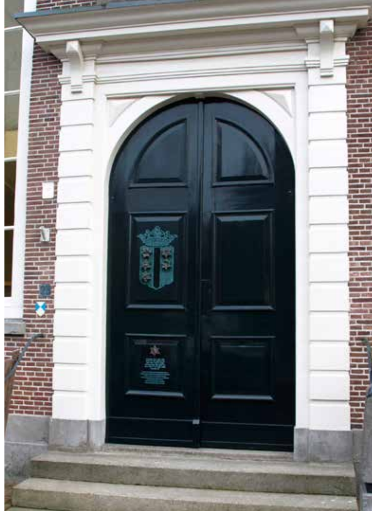
De deur van de synagoge aan de Turfmarkt. De ontbrekende ster staat symbool voor de gedeporteerde en omgekomen joden tijdens de Duitse Bezetting