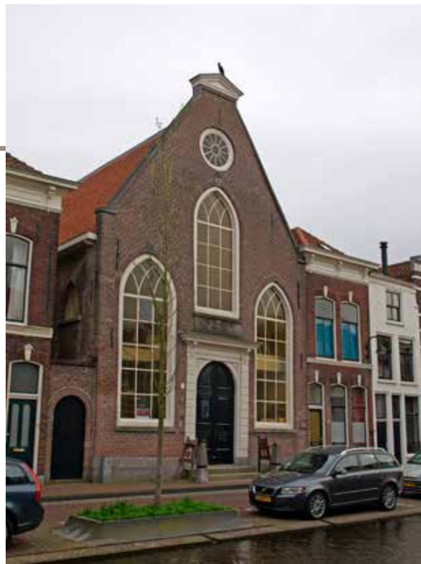
De synagoge aan de Turfmarkt

Vijf jaar geleden kochten wij een huis aan de Turfmarkt, twee deuren verwijderd van de oude synagoge. Als historicus ga je dan natuurlijk meteen op zoek naar de geschiedenis van je nieuwe woning, van de straat en van de directe omgeving. Het verwonderde mij niet dat ook op ons adres joodse Gouwnaars hebben gewoond, maar dat was lang voordat de Duitse bezetter op beestachtige wijze een eind maakte aan de aanwezigheid van een kleine, maar actieve joodse gemeenschap in deze stad. Voor onze deur dus geen Stolpersteine, die zo indringend herinneren aan het drama dat zich door toedoen van de nazi's en hun handlangers voltrok. Maar ons huis draagt wel de herinnering aan de geschiedenis die aan dit drama voorafging en die met de deportatie van vrijwel alle joden uit de stad goeddeels uit het zicht raakte. Want als er geen nieuwe generaties zijn om het verhaal door te vertellen, verstomt het. Bovendien leken de herinneringen aan de joden – zoals die nu worden bewaard – te beginnen en te eindigen bij de gebeurtenissen in de Tweede Wereldoorlog. Dit drama