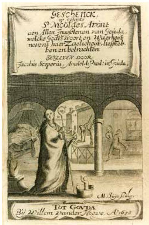
Titelpagina van Sceperus' Geschenck , op geseijde St. Nicolaes avont. Links op de achtergrond de duivelsuitdrijving in Gouda.

welijke paapse misstanden schreef hij van zich af in zijn Geschenck , op geseijde St. Nicolaes avont aen allen ingesetenen van Gouda (1658). Hierin richtte hij zijn pijlen niet alleen op het in de titel genoemde sinterklaasfeest, maar ook op andere vormen van bijgeloof en devotie. Zo stelt hij ook een geruchtmakend geval van duivelsuitdrijving aan de kaak, waarbij een Goudse priester een dierenvel met twee horens over zijn hoofd trok. Deze scene is ook te zien op de titelprent, die gegraveerd is door de Goudse graveur Hendrick Bary.