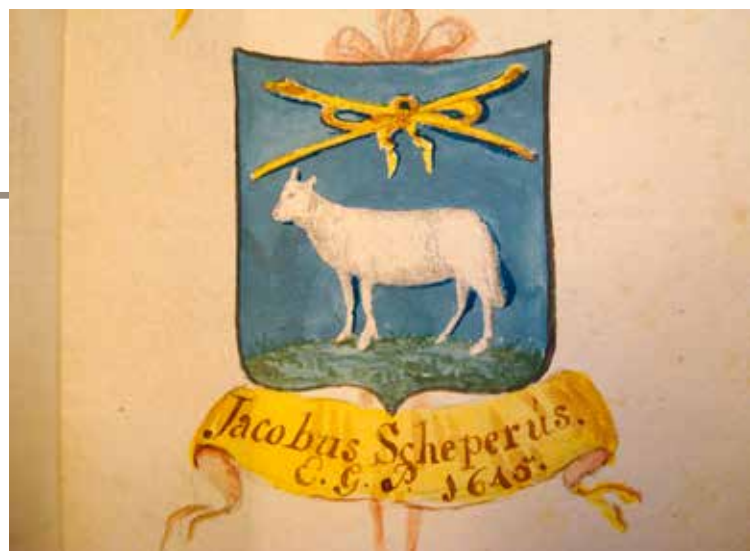
Familiewapen van Sceperus uit het wapenboek van de Librijemeesters.