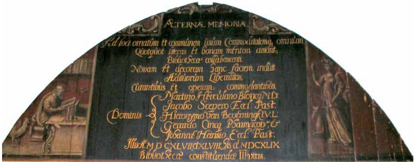
Herdenkingsbord uit de Goudse Librije uit 1649. Onder de namen van de librijemeesters ook Sceperus.

aan de muren grote naamlijsten met prominente schenkers van boeken. 19