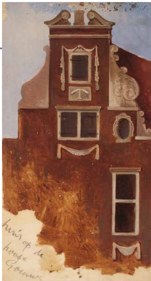
Geveltop van ‘huis op de hooge Gouwe’, olieverfschets van J.J. Bertelman (Collectie Museum Gouda; Tom Haartsen, fotografie)