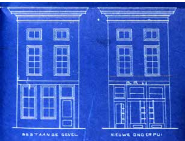
Tekening Hoge Gouwe 129 (SAMH)