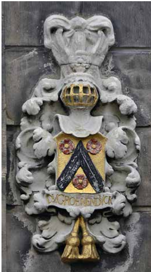
Wapen Donatus op de Waag

in 1643 gebouwde huurhuizen van het Sint Pietersgasthuis in Amsterdam. 14 De top is vrijwel identiek, met het verschil dat bij de Goudse gevel het fronton is onderbroken. De onderkant van de gevel op deze huizen was onversierd. Is dat een aanwijzing dat er bij de aanpassingen van de gevel aan de Hoge Gouwe rond 1800 ook niet veel ‘verloren’ ging? Op basis van het publicatiejaar van Vingboons’ Afbeeldsels is het waarschijnlijk dat de gevel aan de Hoge Gouwe ergens in het derde kwart van de 17e eeuw tot stand kwam, wat overeenkomt met de bezitsperiode van Donatus van Groenendijck.