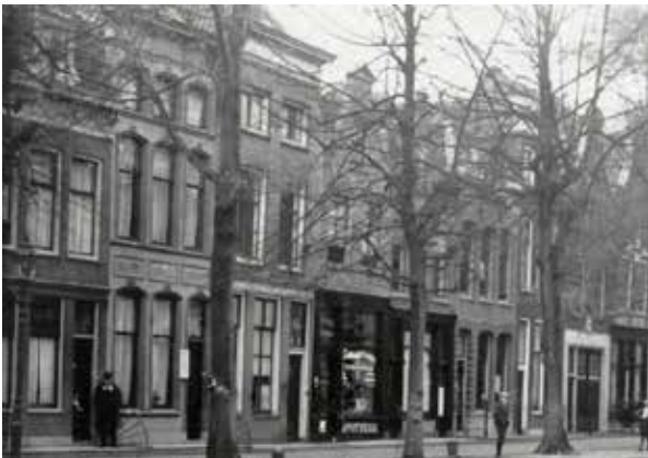
Deel Hoge Gouwe 1929-1930