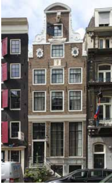
Spuistraat 90, Amsterdam

zodat als het ware een klein driedelig podium van metsel- of natuursteenwerk ontstaat. De ruimte tussen de versmallingen is opgevuld met beeldhouwwerk, zodat de beide zijden van de top toch diagonaal naar elkaar toe lopen. De top wordt bekroond door een gebogen fronton. Een goed nog bestaand voorbeeld is het pand Spuistraat 90 te Amsterdam.