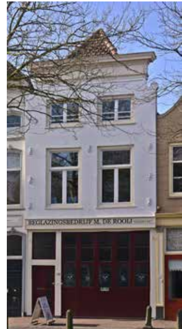
Hoge Gouwe 129

De vraag is natuurlijk wáár deze gevel pronkte. Er zijn, voor zover we weten, geen afbeeldingen, in welke vorm dan ook, bekend van de Hoge Gouwe waarop de gevel valt te herkennen. De op beide afbeeldingen aanwezige gevelsteen van een anker maakt het echter mogelijk vast te stellen waar dit huis stond. Er is aan de Hoge Gouwe slechts één pand dat deze naam droeg, het huidige Hoge Gouwe 129. 7 Dit huis heeft tegenwoordig een andere onderpartij dan op de tekening. Een bouwaanvraag uit 1930 spreekt echter van een verbouwing tot garage met bovenwoning, en op de relevante bouwtekening blijkt inderdaad dat de ondergevel op dat moment gelijk was aan wat Van Krimpen heeft getekend. 8 Een foto uit omstreeks 1920-1930 getuigt hiervan, waardoor het zeker is dat het hier inderdaad Hoge Gouwe 129 betreft. 9