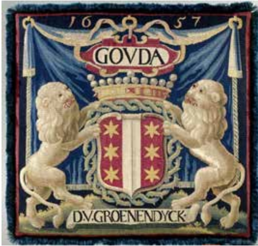
Magistraatkussen Groenendyck (Collectie Rijksmuseum, Amsterdam)