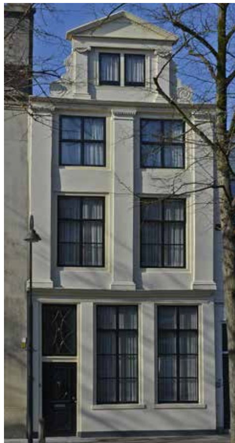
Westhaven 51

het gevolg van bouwvalligheid van de geveltop. In plaats van deze te herstellen werd er voor gekozen om de hele bovenkant 'af te toppen' en te voorzien van een strakke, rechte gootlijst die daarbij ook nog beter paste bij de 19 e -eeuwse smaak. Een pleister op de wond is dat de geveltop in kwestie op zichzelf niet uniek is. Er zijn in Holland nog vrij veel van dit soort geveltoppen te vinden, die een goed idee geven van hoe het pand aan de Hoge Gouwe er heeft uitgezien. Het gaat bij dit type gevel om relatief smalle, hoge panden waarvan het metselwerk inspringt ter hoogte van de kap en daarboven nogmaals,