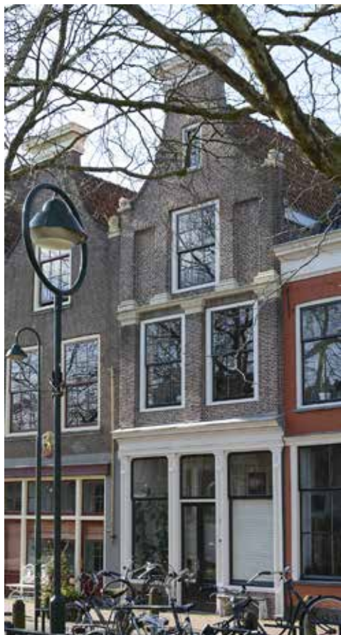
Hoge Gouwe 145

het gevolg van bouwvalligheid van de geveltop. In plaats van deze te herstellen werd er voor gekozen om de hele bovenkant 'af te toppen' en te voorzien van een strakke, rechte gootlijst die daarbij ook nog beter paste bij de 19 e -eeuwse smaak. Een pleister op de wond is dat de geveltop in kwestie op zichzelf niet uniek is. Er zijn in Holland nog vrij veel van dit soort geveltoppen te vinden, die een goed idee geven van hoe het pand aan de Hoge Gouwe er heeft uitgezien. Het gaat bij dit type gevel om relatief smalle, hoge panden waarvan het metselwerk inspringt ter hoogte van de kap en daarboven nogmaals,