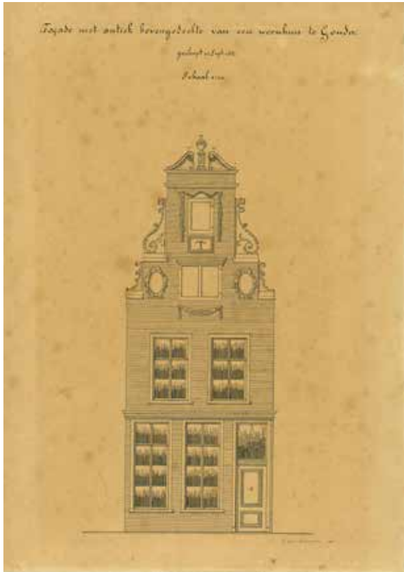
Gevelwand van 'huis op de hooge Gouwe' tekening van L. van Krimpen (Collectie Museum Gouda)