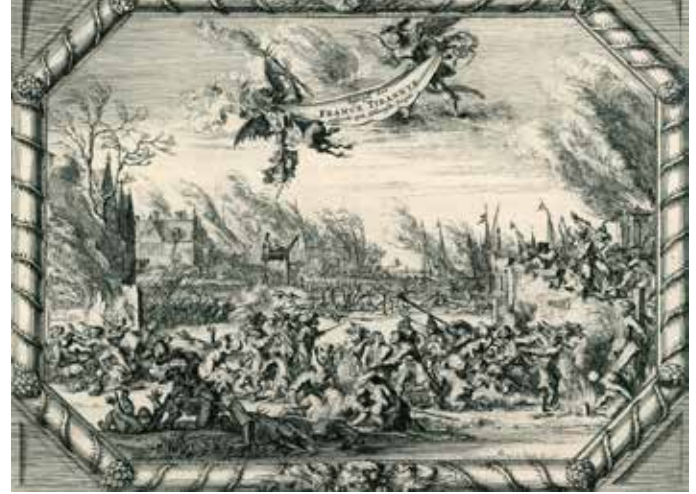
De aanval op Zwammerdam en Bodegraven werd het speerpunt van een effectieve propagandacampagne. De anti-Franse prenten van Romeyn de Hooghe speelden hierin een hoofdrol.

In bovenstaande beschrijving ontbreekt nog één regiment, dat gezien zijn opmerkelijke geschiedenis apart behandeld wordt. Het gaat om het regiment van kolo-