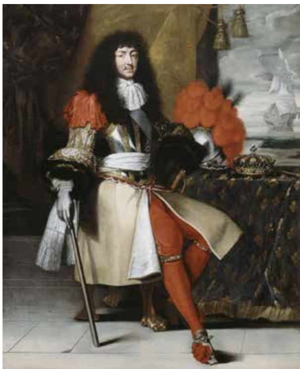
Louis XIV in 1670, naar: Charles Lefebvre. Collectie Château de Versailles. Claire Constans, "Louis XIV, King of France and Navarre (1638–1715)", in: Constans & Salmon 1998, 59.

rol weggelegd. De stad behield zodoende haar middeleeuwse verdedigingswerken.