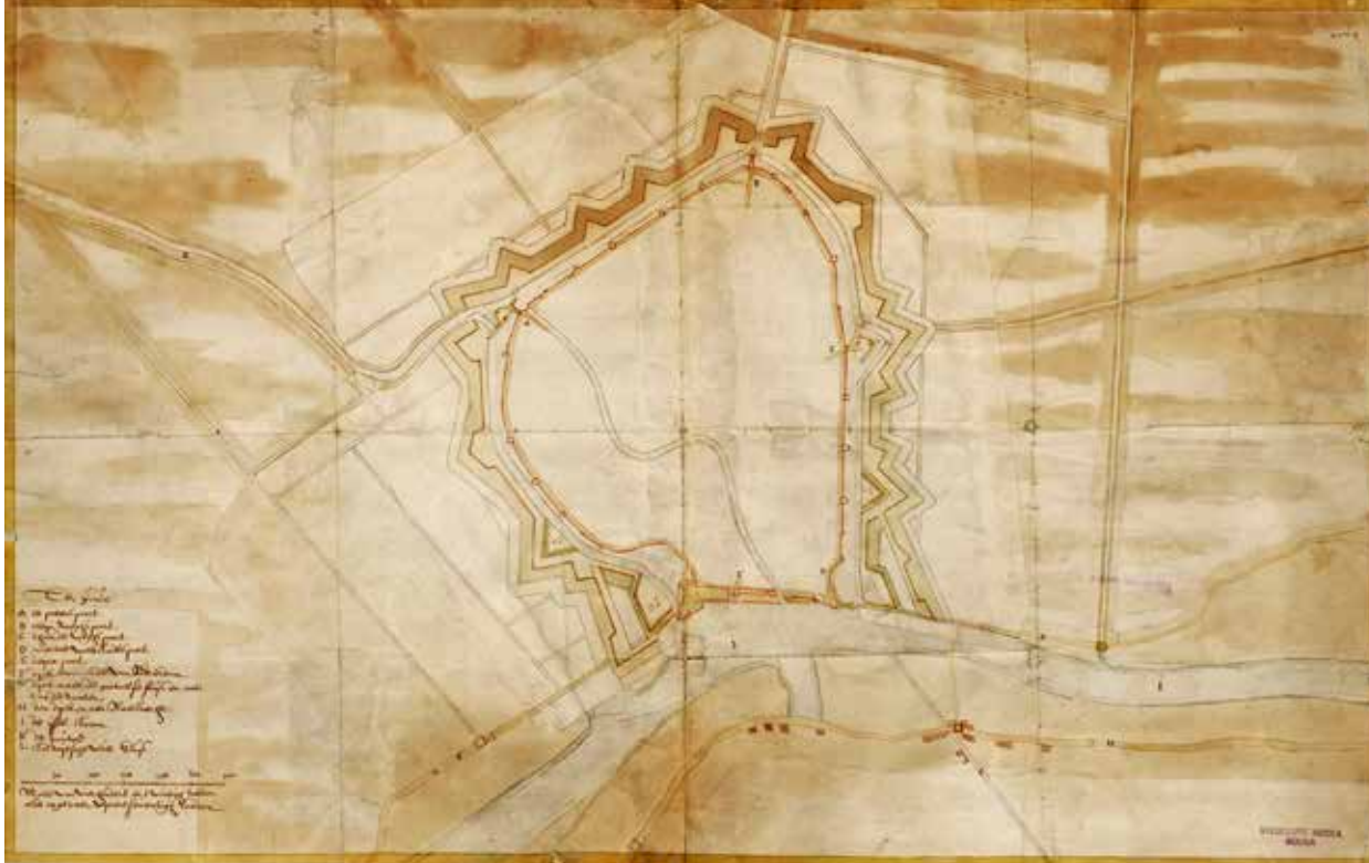
Ruim een halve eeuw voor het Rampjaar 1672 waren er al verregaande plannen gemaakt om Gouda te voorzien van moderne verdedigingswerken. Deze werden niet uitgevoerd. Anoniem, Kaart van Gouda met vestingwerken, ca. 1618 (invnr.2223 F 1 SAMH)

Dit was allerminst een theoretische kwestie. Woerden en Oudewater vielen eind juni in Franse handen. Het Franse leger bevond zich hierdoor op minder dan vier kilometer van het zwakste punt in de Waterlinie. In alderijl werden op 26 juni Goudse vrijwilligers gerekruteerd om de Staatse troepen van de graaf Van Hornes aan de Goejanverwellesluis te assisteren. 5 Een week later moest Gouda in de Statenvergadering toegeven dat 'de pas aan Goeverwelle-sluis niet ten besten voorsien is'. De delegatie uit Rotterdam was het daarmee eens, en meende dat de 'Gouverwelle-sluis in fortificatie en manschap niet wel voorsien is'. Bovendien beklagden de Rotterdammers zich erover 'datter by het volck geen courage is en dat de borgers mee quaed doen als goet'. Zij waren daarom 'wel seer bekommert', waarop Gouda toegaf dat 'het gemeen gevoelen in der Goude is, dat men de post aen Goeverwelle-sluis niet kan defenderen'. 6