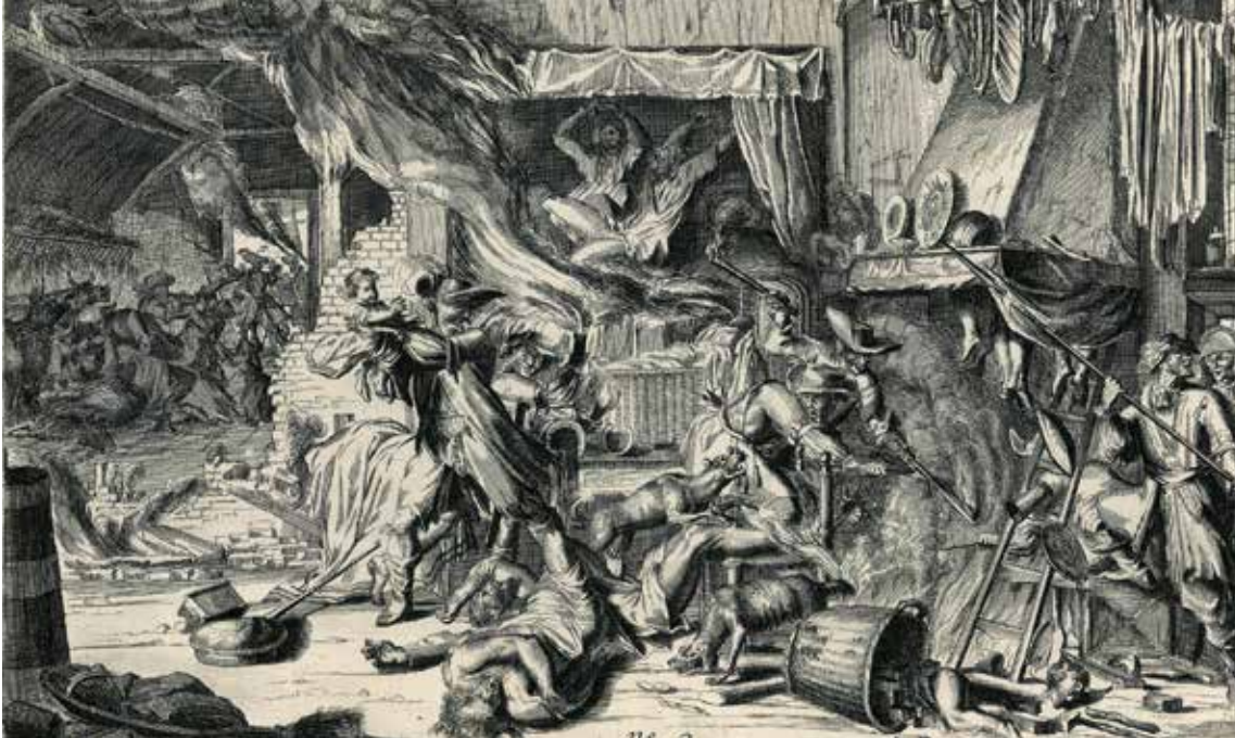
Anti-Franse propaganda waarin hun misdaden breed werden uitgemeten, droeg bij aan de eendracht in de Republiek. Anoniem, naar Romeyn de Hooghe, Wreedheden in een boerenhoeve (1672). Rijksmuseum Amsterdam.

van de stadhouder onder bevel van Von Königsmarck was nabij, en de weg terug naar Utrecht was schijnbaar afgesneden. Bovendien hadden zijn militairen nauwelijks voedsel en andere levensmiddelen meegenomen. De gedeputeerden te velde besloten daarom om de volgende dag over te gaan tot de aanval.