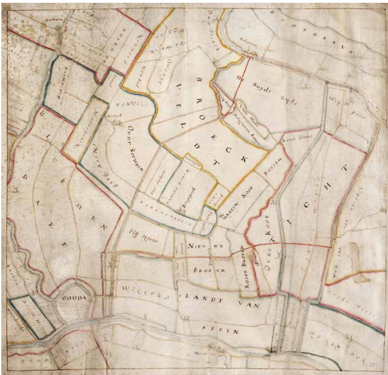
Kaart van de polders in het gebied ruwweg begrensd door Boskoop - Bodegraven - Hekendorp - Gouderak; ca. 1665 ( invnr 2224 C 2 SAMH)