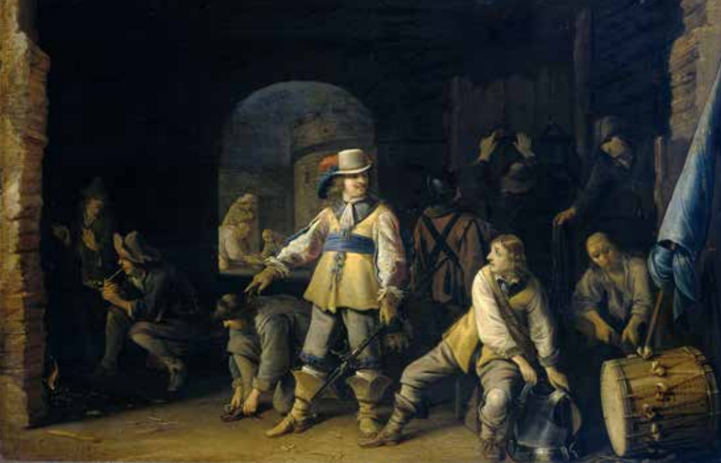
De vele honderden soldaten in Gouda hadden veelal weinig om handen. Zij zullen een grote stempel hebben gedrukt op het sociale leven in de stad. Anthonie Palamedesz, Wachtlokaal met soldaten (1647). Rijksmuseum Amsterdam

Enkele dagen later maakte de stedelijke regering bekend dat er ook twee compagnieën van ruiters naar de stad zouden komen, en dat deze werden ondergebracht in de landen van Steijn en Willens. Blijkbaar stonden deze niet (meer) onder water. De komst van ruiters zou in de weken die volgden de nodige onrust en overlast opleveren, waardoor Gouda zich diverse keren moest wenden tot de militaire superieuren van de commandanten. 37