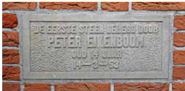
Eerste steen herbouw fabriek Flora geplaatst in 1953