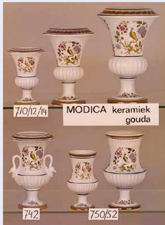
Pagina uit productenboek Modica (collectie Eikenboom, foto Nico J.Boerboom)

Uit de bouwtekening blijkt dat B&W van Gouda op 14 oktober 1969 toestemming hebben gegeven voor het plaatsen van het transformatorstation. In een advertentie in de Goudsche Courant van 27 december 1969 wordt personeel geworven: gieters, draaiers, afwerkers, glazuurders en plateelschilders. De krant doet altijd verslag van de voorjaars- en de najaarsbeurs in Utrecht, waar ook de Goudse aardewerfabrieken hun nieuwe producten tonen. Op 3 maart 1970 wordt melding gemaakt van Modica Keramiek 'uit Flora voortgekomen en nieuwkomer op de beurs. Opvallen doet het kleurcontrast: fel groen en rood in de vazen en kannen; in scherpe tegenstelling tot het Goudse wit dat ook bij andere exposanten aanwezig is.'