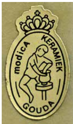
Sticker op Modica-producten