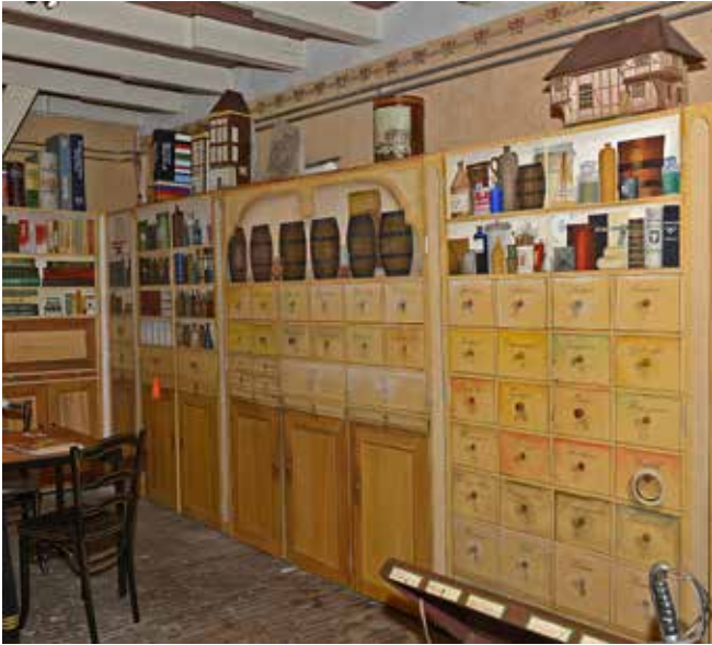
Pigmentenkast