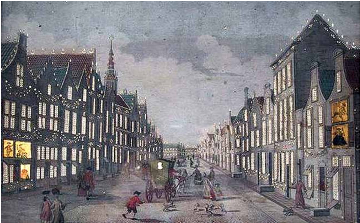
Kleiweg met illuminatie-effect

waarbij niet alleen de ramen geperforeerd moesten worden met kleine en grotere gaatjes om het licht door te laten, maar waar vooraan achter de ramen nog extra figuurtjes aangebracht konden worden. Bij een exemplaar dat onlangs opdook is dat ook daadwerkelijk gebeurd en daarvan laat de achterzijde fraai zien hoe de perforaties heel gericht zijn aangebracht, met als grootste 'lichtgat' het achterraampje van de koets. Dat de straat amper herkenbaar is als de Kleiweg en de toren zich op een positie bevindt waar de Sint-Jan in werkelijkheid onmogelijk in het blikveld kon komen, neemt de betoverde kijker dan graag op de koop toe.