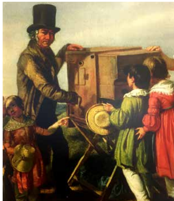
Rondreizende kijkkastattracties op kermissen