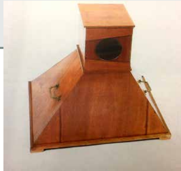
Voorbeeld van een kijkkast met lens en spiegel

Lang voor de uitvinding van de fotografie ontstond bij reizigers de behoefte beelden van bezochte steden en landen die indruk hadden gemaakt vast te houden en te bewaren. Daarnaast was – en is – er een grote markt voor inwoners van steden en dorpen die een fraai stadsgezicht of een mooie afbeelding van monumentale gebouwen uit hun nabije omgeving aan de muur wilden hangen. Ook menige stads- of dorpsgeschiedschrijving werd verfraaid met houtsneden of gravures die een glimp lieten zien van gebouwen en monumenten waar de inwoners trots op waren. In de bekende Beschrijving van Gouda van Ignatius Walvis, de allereerste in druk verschenen geschiedenis van deze stad uit 1713, werden standaard vier van dergelijke gravures meegebonden: een stadsplattegrond en afbeeldingen van het (verdwenen) kasteel, de Sint-Janskerk en het stadhuis. In sommige exemplaren is daarnaast nog een grote opvouwbare gravure aan te treffen van het interieur van de Sint-Janskerk.