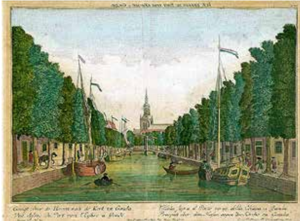
Haven van Gouda

Van de vier Goudse prenten van Probst is die van de Oost- en Westhaven, gezien vanaf ongeveer de Uiterste Brug, het minst overtuigend. Het water is te breed en de straten zijn te smal. Maar hierdoor wordt echter wel het diepte-effect versterkt, wat nadrukkelijk ook de bedoeling was van de maker. Halverwege is de Noodgodsbrug te zien, die hier het uiterlijk heeft van een ophaalbrug. Het is aannemelijk dat deze tamelijk waarheidsgetrouw is. Erachter doemt de Sint-Janskerk op, waarvan de toren enigszins in de buurt komt van de werkelijkheid. Het daaraan gekoppelde kerkdak is echter perspectivistisch onjuist. Het paard, de mensen, de schepen en de roeiboten geven het geheel een levendige aanblik. De tekst boven de prent is in spiegelschrift, waaruit valt op te maken dat deze versie oorspronkelijk bedoeld was voor een opticalens.