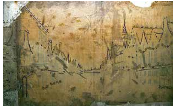
Achterzijde met perforaties van Kleiweg-prent

achterzijde en het voorwerk van het Duitse standaardwerk van Sixt von Kapff over Probst. 1