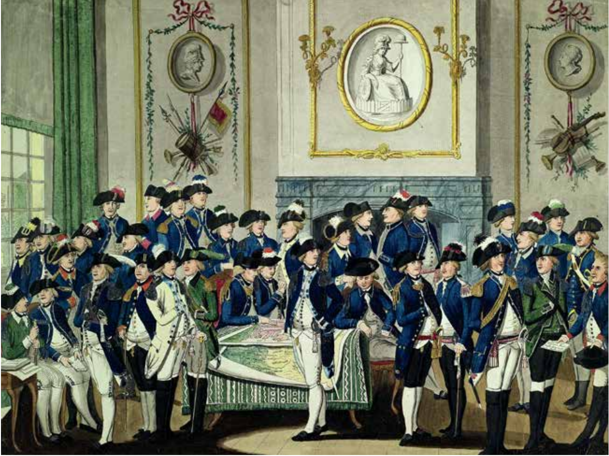
C. van Waard, Zaal met 35 schutters in verschillende monteringen (Amsterdam-Rijksmuseum)

ontpopte zich tot een openlijke voorvechter van democratie en volksinvloed en werd een fanatiek tegenstander van wat hij ‘baantjesjagers’ noemde. Ook was hij in zijn jeugdige onbezonnenheid niet bang om in de vergaderingen zijn mede stadsbestuurders openlijk te verwijten dat ze te veel uit eigenbelang handelden.