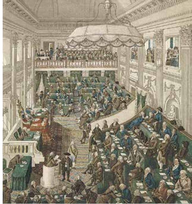
G. Kockers, Zitting Eerste Nationale Vergadering in Den Haag (Amsterdam-Rijksmuseum)

Na een kort ziekbed stierf Blauw op 12 oktober 1829.