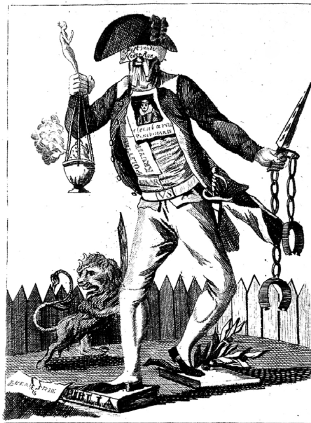
AFBEELDING VAN EEN KEES, WEEGLUIS, AVIJOENVREETER, AMOKSPOEGER. OF HEEDENDAAGSCHE PATRIOT.

20. SAMH, 0566.7, 140. Vanaf januari 1786 is hij aanwezig bij de vergaderingen ter vervanging van De Lange van Wijngaarden. SAMH, 0001.5038, 'calandier van de ordinaris besoignes daer op de heeren burgermeesteren der stad Goude jaerlijcks te letten hebben', 1750. Lijst geformeert bij haar Ed.Gr. Mog. Commissarissen omme daaruijt een quohier zoo voor 't amptgeld, als den twee honderdste penning te kunnen worden gearresteerd, bestaande in seeven colommen hieronder gespecificieerd in de 18e julij 1752 . Hieruit blijkt dat de achtentwintig raadsleden ieder 1000 gulden ontvangen en vrijgesteld zijn van de 20ste penning.