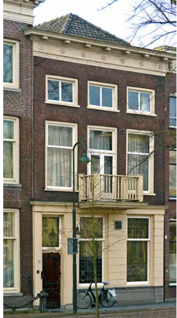
Westhaven 62

Met welke taken de kerkmeesters zich bezig moesten houden was in de resolutie van 1776 duidelijk omschreven. 17 De kerkmeesters vormden in feite het algemeen bestuur, verantwoordelijk voor financiën, facilitaire za-