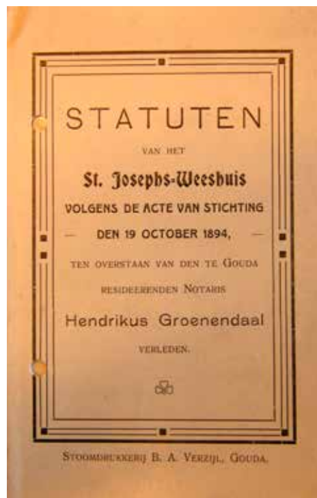
Omslag van de Statuten van St. Joseph Weeshuis (SAMH)