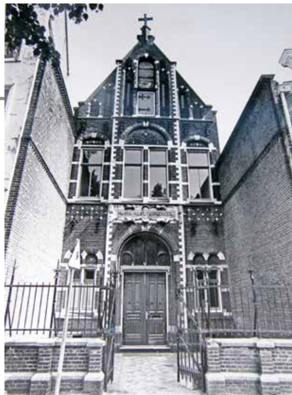
Het Rooms-katholiek Weeshuis aan de Hoge Gouwe