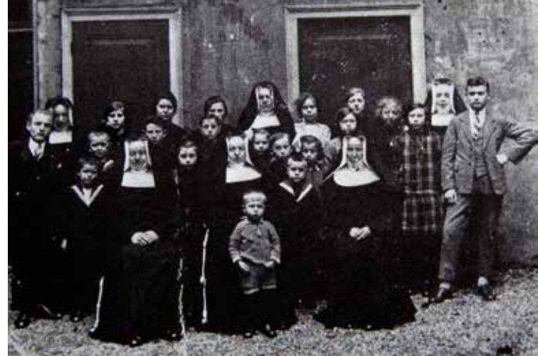
Foto gemaakt bij het afscheid van het weeshuis in 1928

De wezen zitten netjes in de kleren. Gewone kleding wordt verstrekt. Uitmuntend goed gedrag wordt beloond met een speciaal uitje: een bedevaartreis naar Kevelaer. Dit uitstapje maakt diepe indruk op kinderen die nooit buiten Gouda komen. Als het kermis in Gouda is, mogen de kinderen naar de zogenaamde kinderkermissen. Ook gaan ze dan een middagje spelen in de patronaats-tuin, waar ze onthaald worden op wafels en limonade. De wezen moeten het huis verlaten als ze 21 worden. Ze krijgen dan een uitzet. De meisjes zes stuks ondergoed,