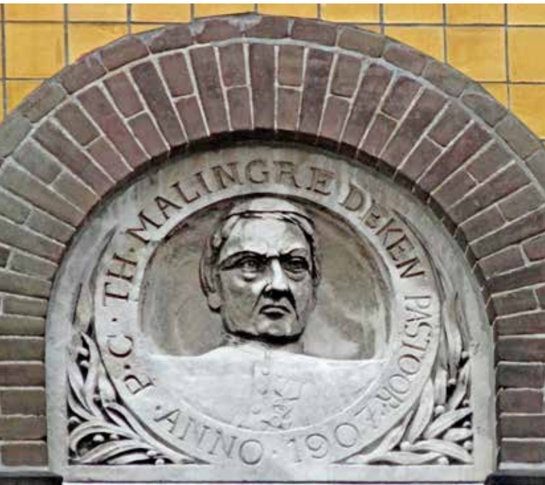
Gevelsteen met de beeltenis van Monsigneur Malingré

Volgens Van Heel was deken Malingré tegen een