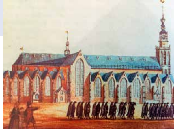
Begrafenistoet bij de Sint-Janskerk. Gekleurde afbeelding in het register op de Resolutieboeken van de St.-Janskerk (SAMH)

Met het schrappen van vijf van de zeven sacramenten – alleen Doop en Avondmaal werden gehandhaafd – verdwenen ook de zogeheten laatste sacramenten (Biecht, Ziekenzalving en Laatste Communie). Verder waren de gebeden voor het zielenheil van de overledene, het laten lezen van zielmissen, het opsteken van kaarsen en het aanroepen van Maria als middelares voortaan taboe. De troost die de katholieke kerk daarmee bood aan zieken en stervenden werd in de nieuwe gereformeerde kerk vervangen door een andere boodschap, waarbij troost bovenal gezocht werd in het voorhouden en uitleggen van het Woord Gods.