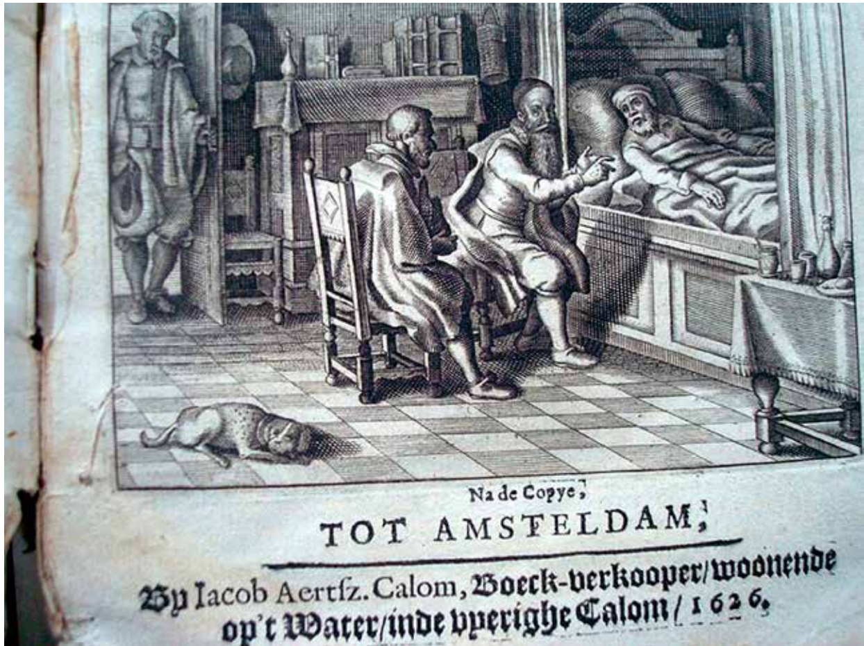
Titelprint Poppius' Siecken-troost

geheim houden. Afgaand op een ornament in het boekje, dat ook in andere werken voorkomt, lijkt het van de personen gekomen te zijn bij Pieter Rammazeyn, remonstrants boekdrukker die vanaf ongeveer 1619 een drukkerij had aan de Korte Groenendaal. In 1628, toen de vervolgingen van de remonstranten geluwd waren, werd het boekje opnieuw gedrukt, nu in Amsterdam. Van deze herdruk zijn meerdere exemplaren bewaard gebleven.