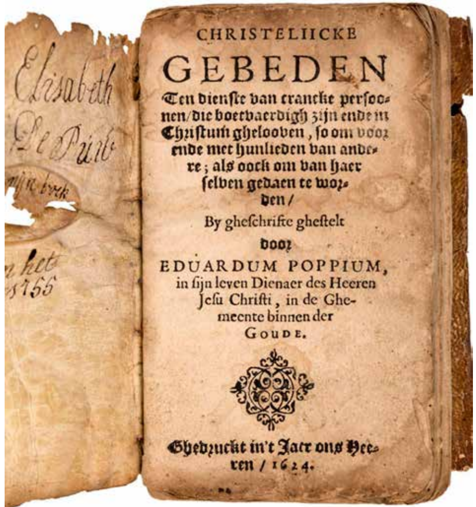
Titelpagina Poppius' Christeliecke gebeden

Van dit boekje is voor zover bekend slechts één exemplaar bewaard gebleven, dat vorig jaar opdook op een veiling in San Francisco. Het heeft een sleets, overslaand perkamenten bandje. Het kleinood kent een klein octavoformaat, geschikt om zo in de binnenzak bij je te