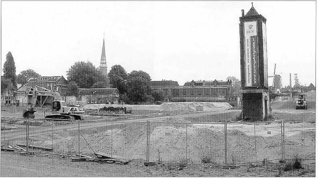
De Koningshoflocatie aan de Raam.

deze misbaksels met terugwerkende kracht bij naam en toenaam ter verantwoording te roepen; al was het slechts in de vorm van geschiedschrijving. Daar zou dan tegelijkertijd een preventieve werking van uit kunnen gaan naar de bouwers van nu. Willen zij niet voor eeuwig in het zwartboek komen te staan als verkwanselaars van het stedelijk schoon, dan doen zij er goed aan te bouwen met liefde en oog voor de omgeving. Maar dat er gebouwd wordt is op zichzelf een goede zaak. Gouda is niet (meer) dood, Gouda leeft!