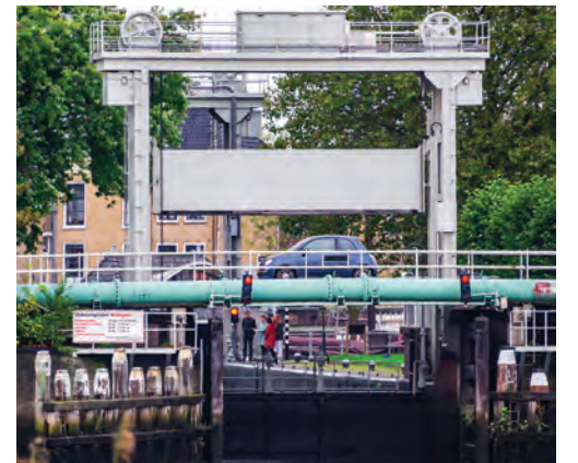
Verschillende infrastructures komen hier in 2019 bijeen.