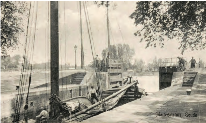
Een zeilschip in de Mallegatsluis, met zicht op de Hollandsche IJssel, ca. 1920.