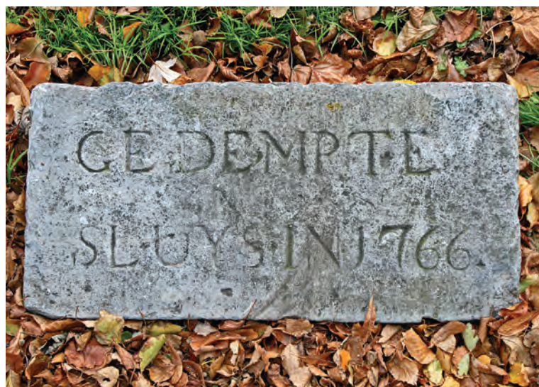
Herinneringssteen. Geeft thans nog de plaats aan waar de tweede Mallegatsluis heeft gelegen

Ondanks een renovatie in 1884 was de Mallegatsluis toen eigenlijk niet meer 'van deze tijd'. Grotere boten moesten dagen wachten om te passeren, omdat dit alleen kon als ze in één keer van de Turfsingel naar de IJssel konden varen. Onder de schippers ontstond 'filestress', die soms tot gevechten leidde. In 1916 luidde de provincie Zuid-Holland de noodklok; de Mallegatsluis was een rem op de economische bedrijvigheid. Twee jaar later werd besloten tot de aanleg van een nieuwe vaarroute buiten Gouda om. Deze werd afgerond op 6 september 1935. Dat het kanaal en de Nieuwe Sluis (later de Julianasluis) al na drie dagen in gebruik werden genomen kwam door een ongeluk in de Mallegatsluis, die beschadigd raakte en tijdelijk onbruikbaar was.