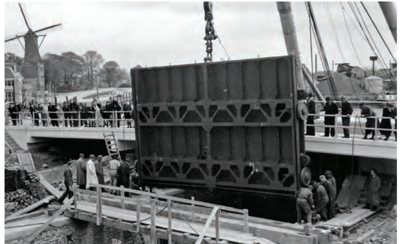
Plaatsing van één van de hefdeuren tijdens de verbouwing van de sluis in 1941.