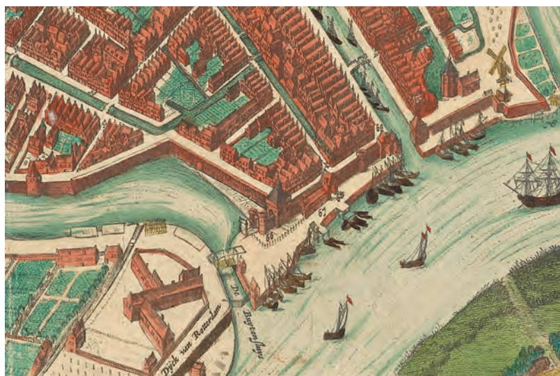
De tweede Mallegatsluis (toen nog Buytensluys geheten) op een ingekleurde stadskarta van Joan Blaeu, 1649.

doeleinden worden gebruikt, maar werd al snel ook opengesteld voor de binnenvaart. De sluis speelde in 1672 opnieuw een militaire rol bij de Oude Hollandse Waterlinie. Toen Gouda de sluisdeuren lang openhield stroomde er zo veel water door dat woeste boeren uit de omgeving van Waddinxveen het stadsbestuur gijzelden en eisten dat de sluis werd gesloten! Halverwege de achttiende eeuw was de sluis er slecht aan toe, maar een langdurige sluiting voor reparatie of vervanging was voor Gouda onbespreekbaar. De stad presenteerde een alternatief: tussen de sluis en stadsmuren kon een nieuwe sluis worden aangelegd. Het voorstel werd door de Staten geaccepteerd, en de derde Mallegatsluis werd in 1764 aangelegd. De oude sluis werd twee jaar later ontmanteld; er waren dus korte tijd twee sluisen.