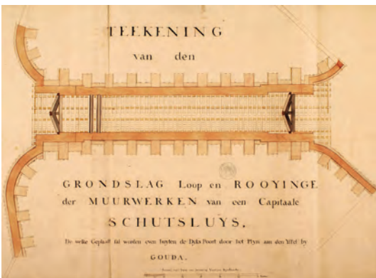
Ontwerptekening voor de huidige Mallegatsluis.