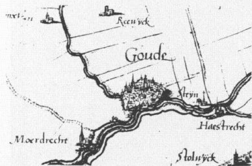
Fragment plattegrond Gouda - Steyn - Haastrecht.