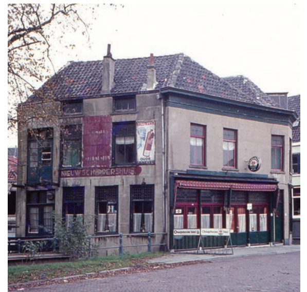
Het ooit zo imposante Schipperscafé in 1970.