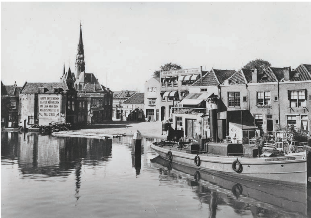
De Bogen was in 1950 nog een gezellige woon- en werkomgeving.