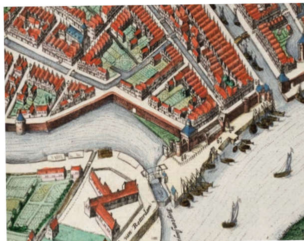
Detail uit de stadskaart van Blaeu uit 1649. Zichtbaar is de Rotterdamse Poort als onderdeel van de stadsmuur.

café met biljart en tegen de achterwand een pianola. Al na enkele jaren begonnen de panden te verzakken, vermoedelijk door de slechte bodem. Niet vreemd, want ook de oude stadsmuren verzakten regelmatig.