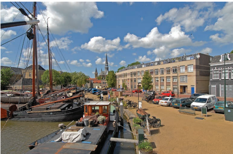
De Bogen in het heden met de nieuwbouw en de Museumhaven

De woningen hebben ongeveer 80 jaar op deze plek gestaan. Rond 1950 toen het autoverkeer begon toe te nemen en de vrachtauto de taak van het vrachtschip overnam, ontstonden plannen om de Raam te dempen en een brede doorgaande weg naar de Veerstal te maken. Om dit te kunnen realiseren besloot de gemeente in 1959 dat het huizenblok langs het water aan de Bogen afgebroken moest worden. Tussen 1962 en 1969 werden de woningen op de hoek van de Raam en de Vest en de eerste woningen aan de Bogen afgebroken in het kader van de zogenaamde krotopruijning. Vanuit het Rijk werd voor elk afgebroken krot een premie van 750 gulden uitgekeerd. Enkele pandeigenaren misbruikten deze regeling voor eigen gewin. De actiegroep De Kritische Siropwafel voerde in 1975 tevergeefs actie tegen de sloop van het café Nieuwe Schippershuis aan de Veerstal. Helaas werd 1976 het café wegens bouwvalligheid afgebroken en kreeg Gouda de open ruimte met Museumhaven en parkeerplaats zoals we die nu kennen. Wie nu langs de Museumhaven loopt, kan genieten van de historische schepen. Daarbij had de stadsmuur niet misstaan.