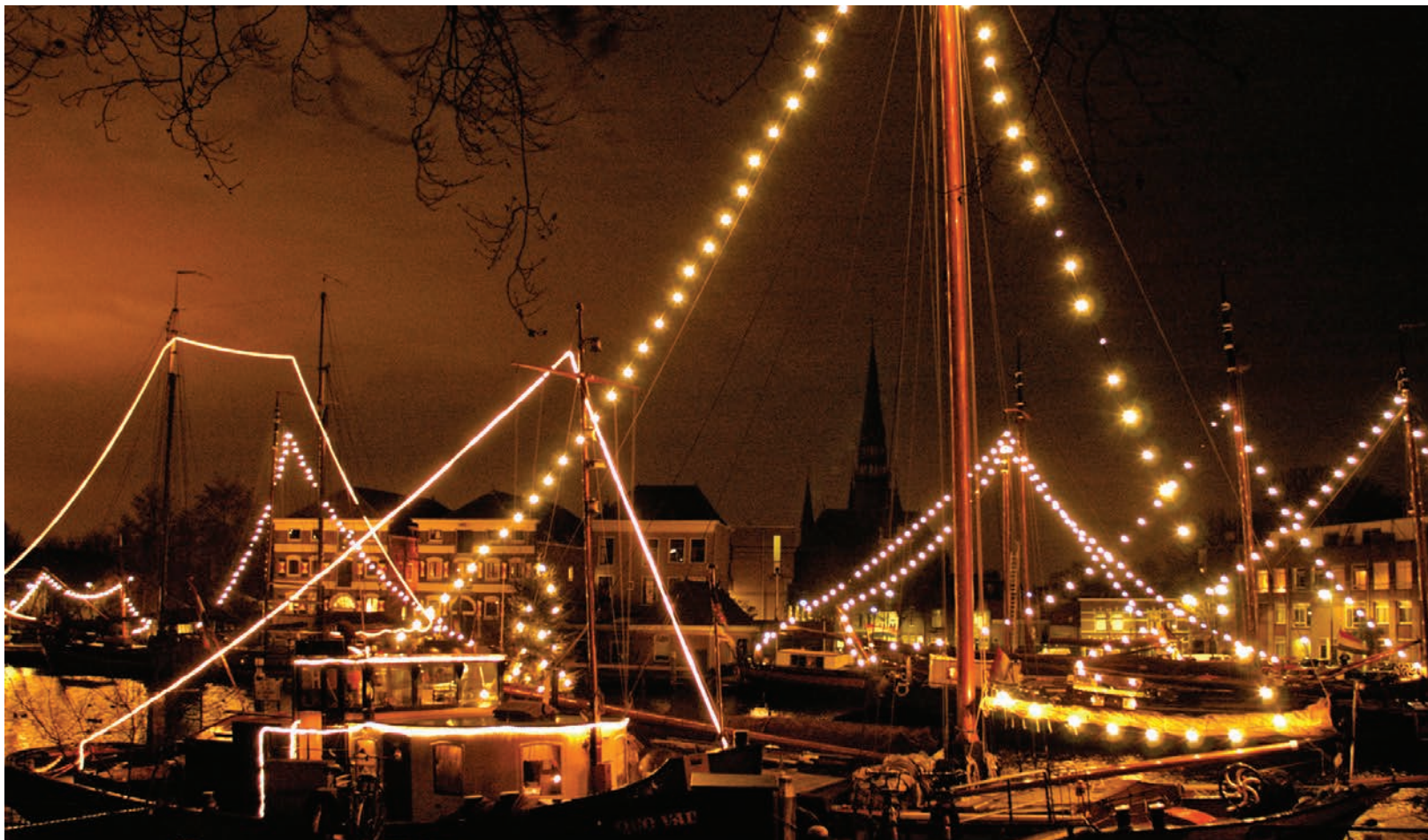
De Museumhaven met feestelijk verlichte schepen tijdens de donkere decemberavonden

Sinds 1990 kunnen we in Gouda genieten van de schitterende oude bewoonde boten die goed onderhouden in de Museumhaven nabij de Mallegatsluis liggen. De Museumhaven, het nabijgelegen Schipperswachtlokaal en het werfterrein met werfhuis geven dit gebied een industriële uitstraling. Dat is echter niet altijd zo geweest. Voordat de eerste schepen de Museumhaven binnenvoeren, had de gemeente Gouda andere plannen met dit gebied.