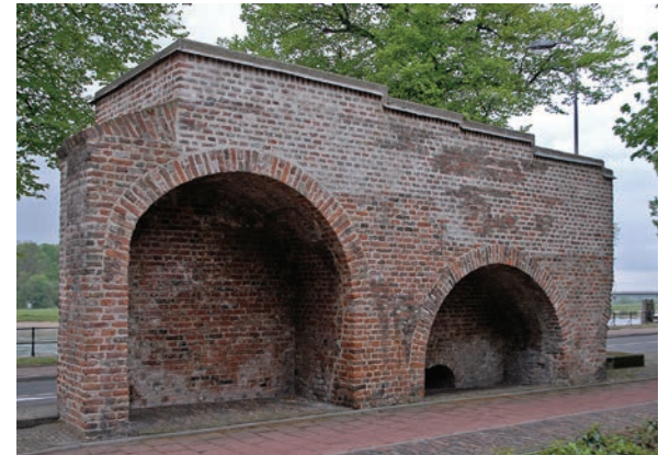
De stadsmuur bestond deels uit gemetselde bogen. Deze foto, genomen in Deventer, laat daar een voorbeeld van zien.