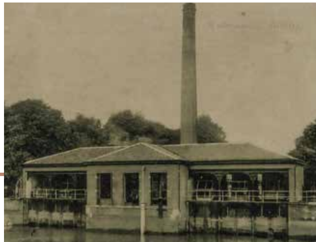
Het stoomgemaal aan de Goejanverwelledijk / Fluwelensingel, ca. 1905