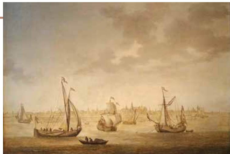
Afb. 1 Gezicht op de stad van den IJselkant, met onderscheidene vaartuigen, Christoffel Pierson 1684 (Museum Gouda)

Die schepen leken netjes geschilderd, maar ze waren nogal vreemd over de rivier verspreid, één leek tegen de kant op te zeilen, een ander voer de rivier dwars over, de onderlinge verhoudingen waren scheef, er klopte iets niet! Waren die schepen er misschien later in geschilderd? Ging het om het stadsgezicht? De stad was mooi maar zo klein afgebeeld, dat ze eerder ‘koningin van de achtergrond’ leek te spelen. Zouden die rare schepen dan toch een grotere rol dan alleen versiering vervullen? Maar wat stelde het schilderij dán voor? Pas in 2014, toen het schilderij schoongemaakt en gerestaureerd werd, vroeg ik me opnieuw af wat er toch met dat rare schilderij bedoeld werd. Ik dook in de gemeentelijke ar-