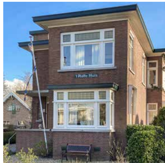
De ouderlijke woning op Platteweg 4