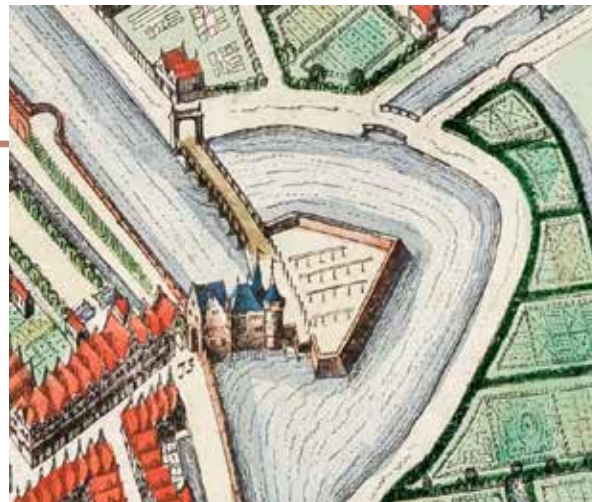
J. Blaeu, Toonneel der steden van de Verenighde Nederlanden, Amsterdam 1647-1649

In Holland was turf de belangrijkste brandstof tot de komst van steenkool in de 19e eeuw. Om aan die turf te komen werd er op grote schaal veen afgestoken. Na de introductie van de baggerbeugel kon er ook onder water turf worden gebaggerd, met als gevolg dat er enorme plassen ontstonden. Zoals het Haarlemmermeer, dat uitgroeide tot het grootste meer van Holland met een oppervlakte van 18.000 hectare. En tot een van de gevaarlijkste meren van Holland, want bij storm werden grote stukken land weggeslagen en konden complete