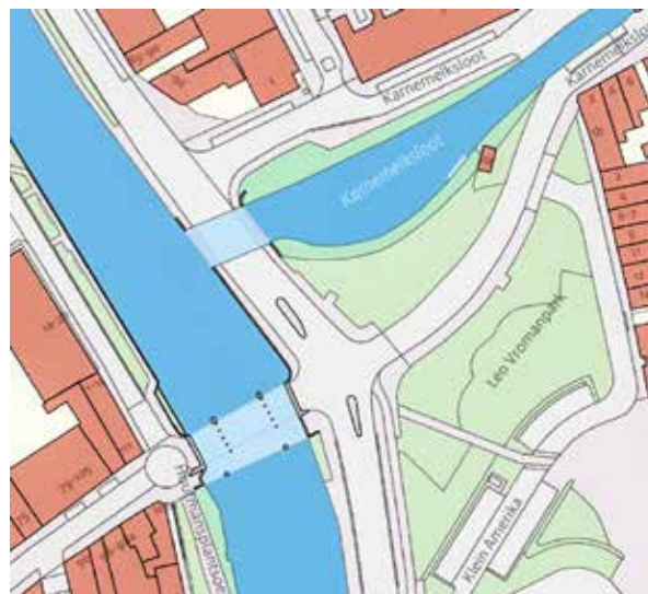
https://gis.gouda.nl/viewer/app/Basis_open (gelezen 12 maart 2022)