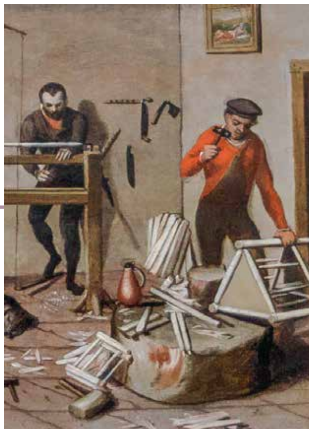
Uitsnede van de predella van het Jozefaltaar (Museum Gouda)