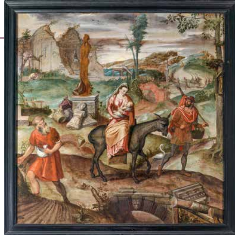
Het middenpaneel van het Jozefaltaarstuk (Museum Gouda)